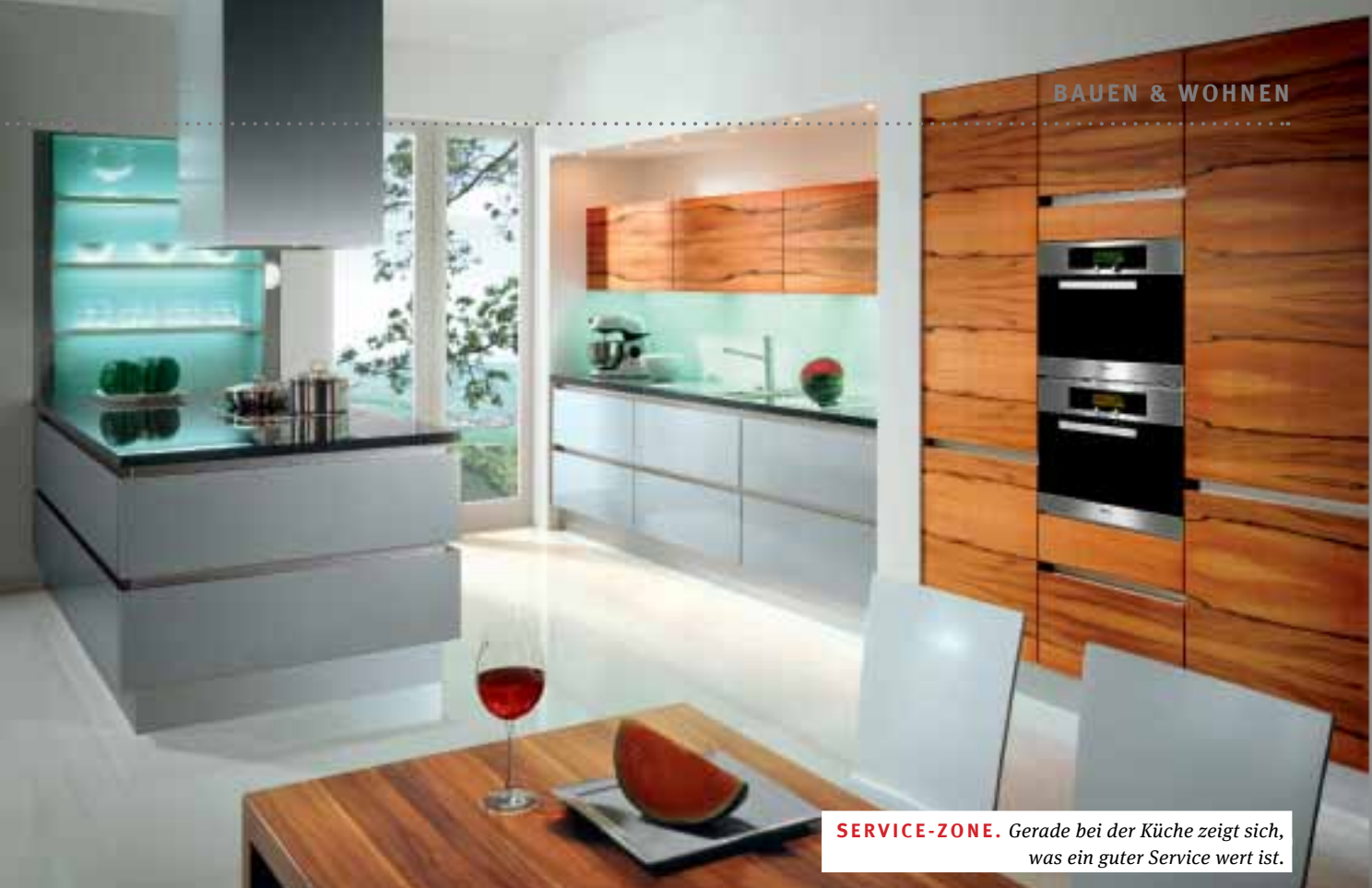
SERVICE-ZONE. Gerade bei der Küche zeigt sich, was ein guter Service wert ist.