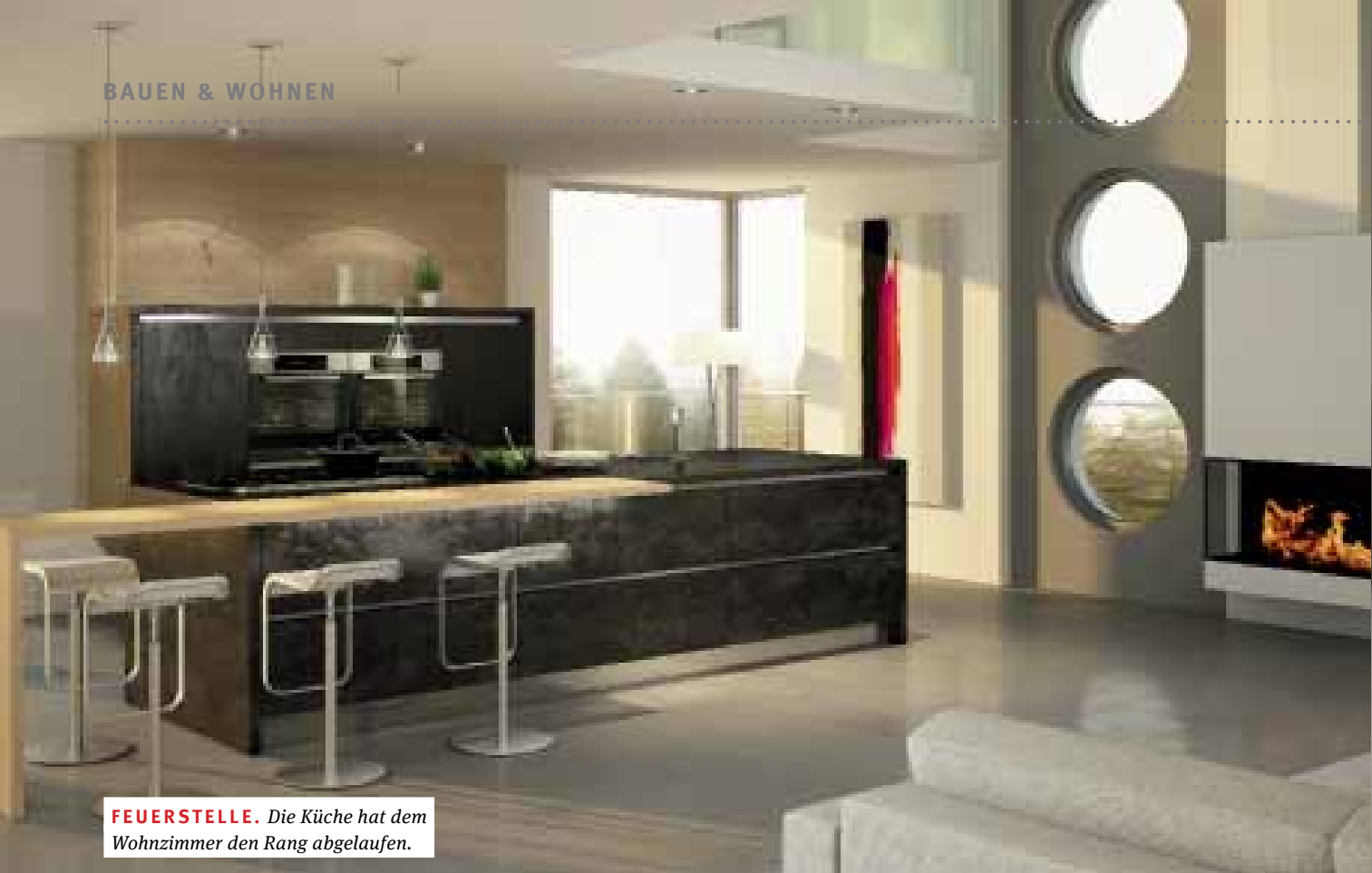
FEUERSTELLE. Die Küche hat dem Wohnzimmer den Rang abgelaufen.